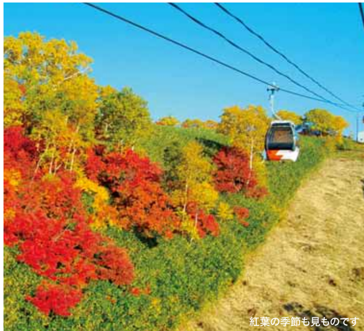
紅葉の季節も見ものです