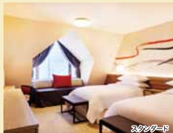
スタジオスイート