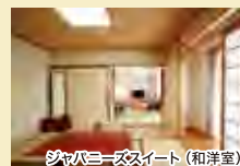
シャビキーズスイート (和洋室)