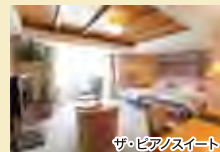
ザ・ピアノスイート