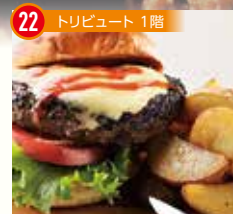
22 トリビュート 1階