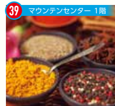
39 マウンテンセンター 1階

マウンテン カフェ&ラウンジ * グレンデを一望できるカフェで、本格スリランカカレーをお楽しみください。