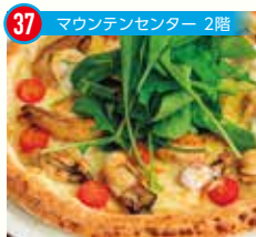
37 マウンテンセンター 2階