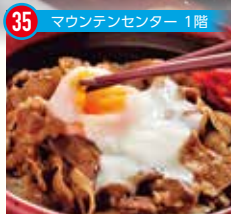
35 マウンテンセンター 1階