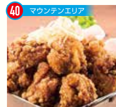
40 マウンテンエリア

グレンデ屋台 SHIRO * 屋台定番メニューと各種ドリンクなどのテイクアウトメニュー。