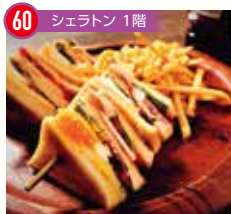
60 シェラトン 1階