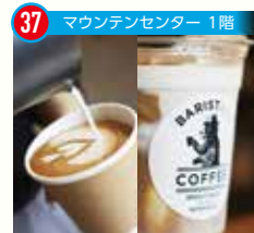
37 マウンテンセンター 1階

パリスタートコーヒーキヨク * ミルクにフォーカスしたコーヒースタンド。軽食も人気。