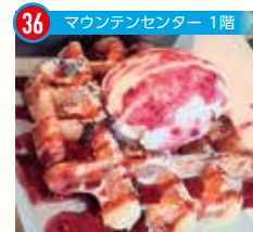
36 マウンテンセンター 1階