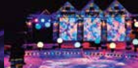
プロジェクションマッピング