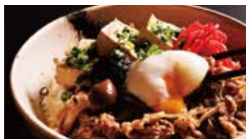
キロロ Gondola 山頂駅