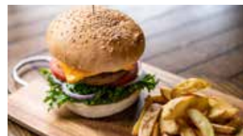
Yu Kiroro 1階

●営業時間/ドリンク 10:00~14:30 L.O. ランチ 11:00~14:00 L.O.