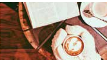
マウンテンセンター 1階

●営業時間/ドリンク 9:00~16:30 L.O. ランチ 11:00~15:00 L.O.