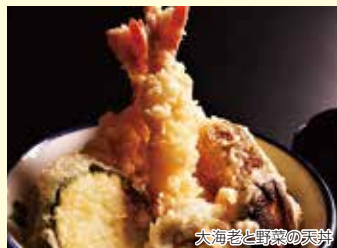
大海老と真鱈の天丼