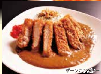
ポークカツカレー