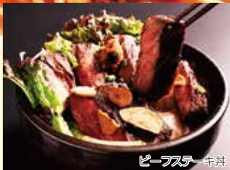
ビーフステーキ丼