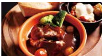
マウンテンセンター 1階

●営業時間/ドリンク 10:00~16:00 L.O. ランチ 11:00~15:00 L.O.