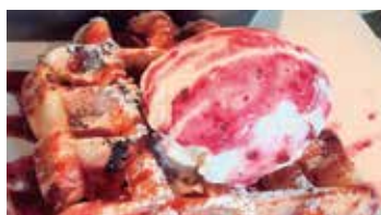
マウンテンセンター 1階

●営業時間/朝食 6:45~10:00 L.O. ランチ 11:30~14:00 L.O. 夕食 17:30~22:00 L.O.