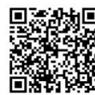
キロロWEBサイト QRコード